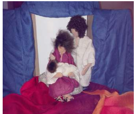
"Egli-Figuren-Krippe" am Rosa-Mihalka-Platz