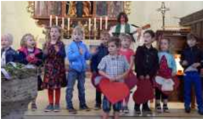
Die Kinder der Kita beim Gottesdienst (hier: Mai 2019)

Am Sonntag, 9. Februar um 10 Uhr laden wir herzlich zum Familienfreundlichen Gottesdienst mit dem Thema „Josef und seine Brüder“ im Gemeindehaus ein. Die Kinder und Erzieherinnen der Kindertagesstätte werden diesen Gottesdienst mitgestalten. Im Anschluss gibt es eine Nudelparty.