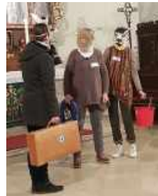
„Tiger und Bär“

Knapp 90 Kinder, Konfis und Mitarbeitende erlebten einen wunderschönen Kinderbibeltag.